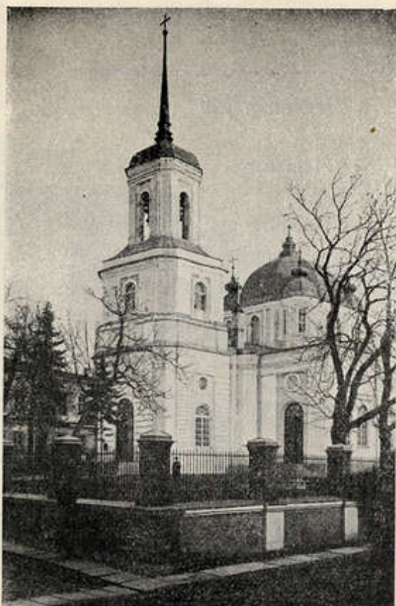
72. joon. Uspenski kirik Uspenski kirik (l'église de l'Assomption) à coupole de style byzantin.

ehitati esmakordselt üles Vene keisrinna Elisabeti käsul 1752.—1753. a. endise dominiiklaste kiriku kohale. Põles 1775. a. maha ning ehitati peale seda nii sees- kui välispidi toredam üles.